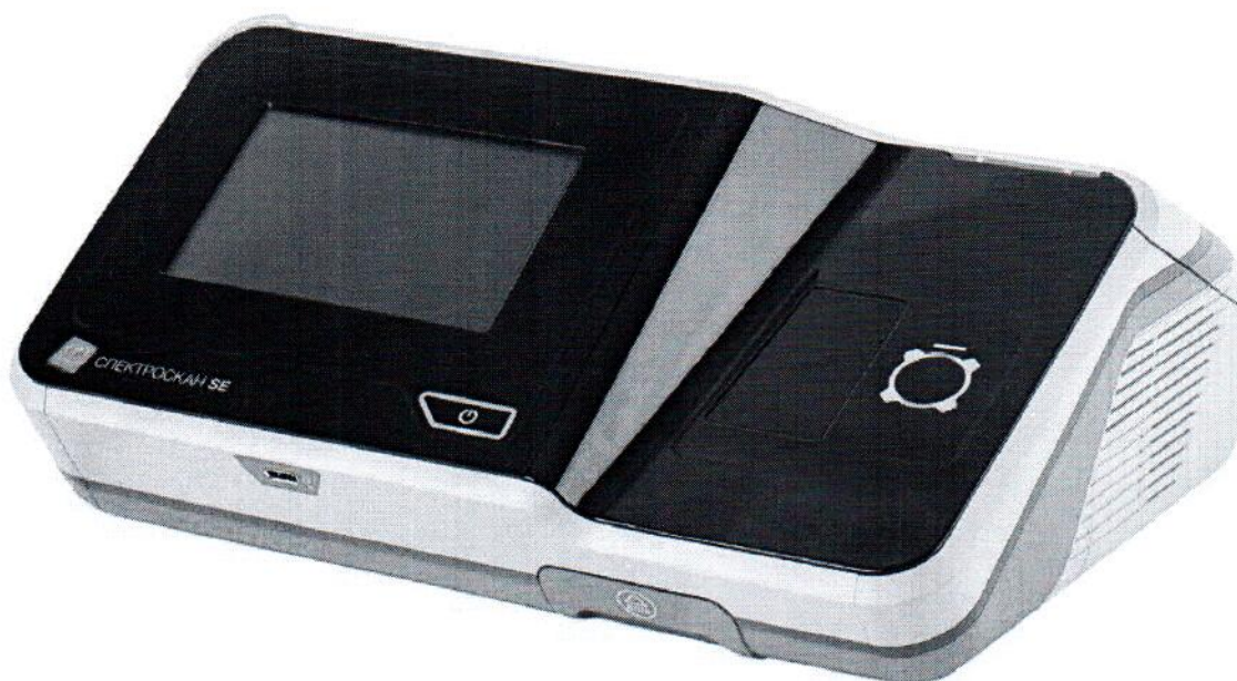
Рисунок 1 – Общий вид анализатора