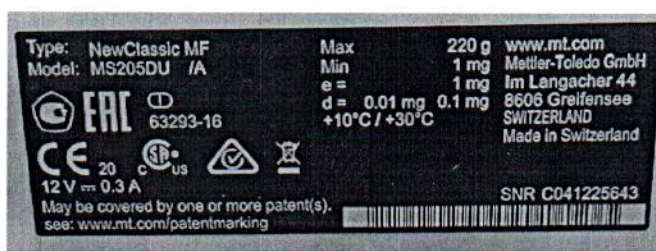
Рисунок 2.1 – Образец маркировки весов