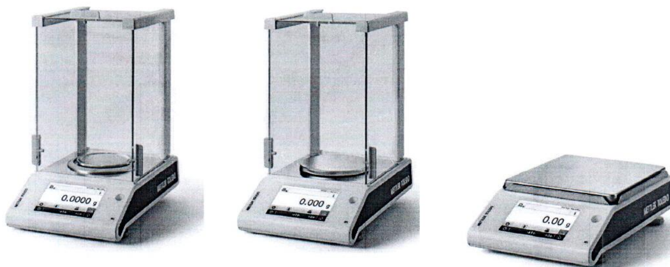
Общий вид весов модификаций ML