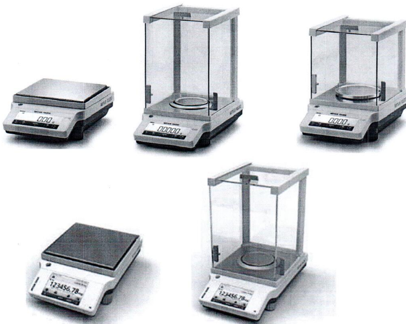
Общий вид весов модификаций ME