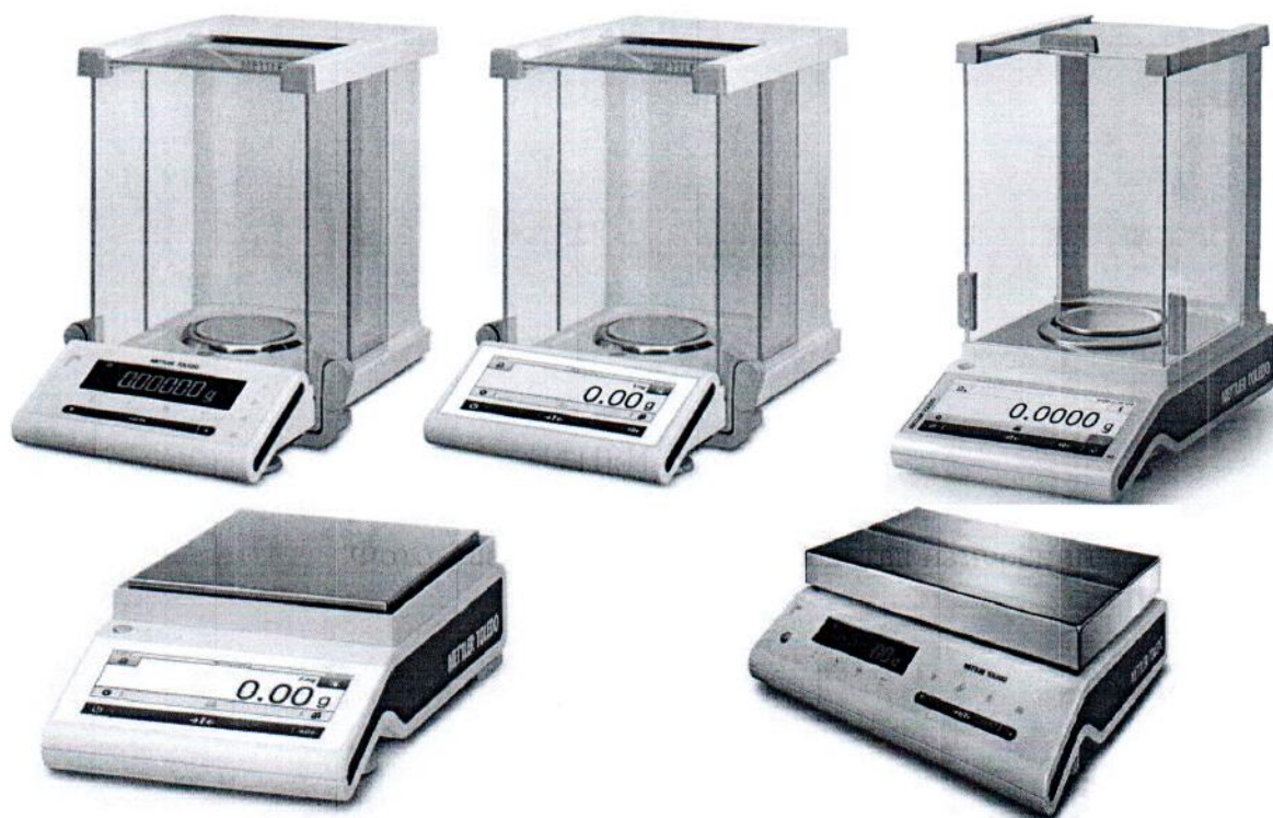
Общий вид весов модификаций MS