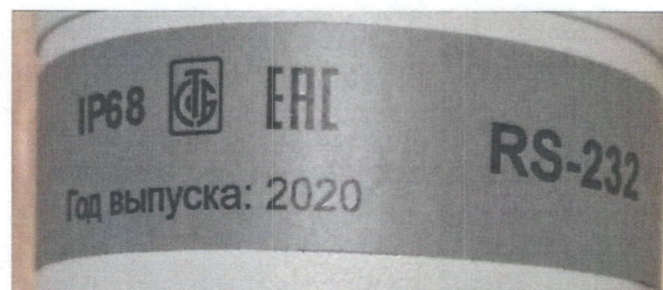
Рисунок 1.2 – Маркировка блоков детектирования