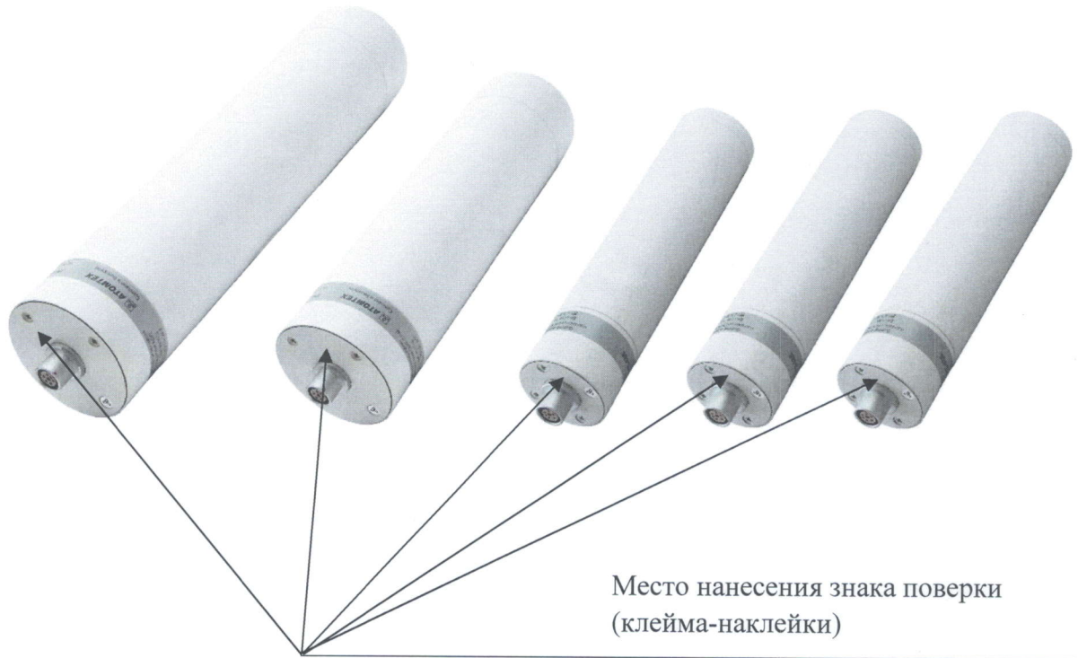
Рисунок 2 – Схема с указанием места нанесения знака поверки (клейма-наклейки)

Схема с указанием места нанесения знака поверки средств измерений