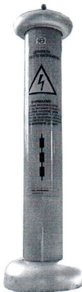
Рисунок 1 – Общий вид делителя высокого напряжения ДВН