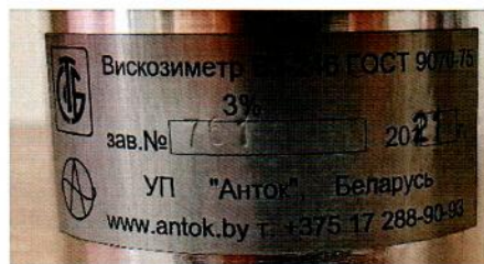
Рисунок А.2 – Пример маркировки