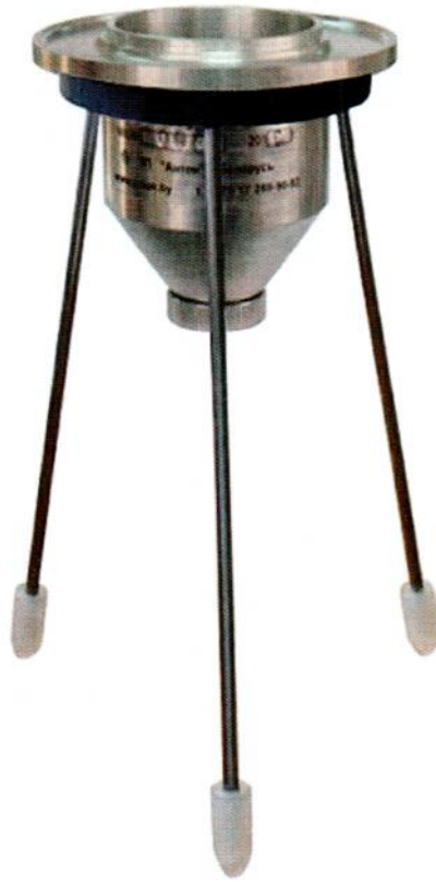
Рисунок А.1 – Внешний вид вискозиметров

Фотографии общего вида средства измерений