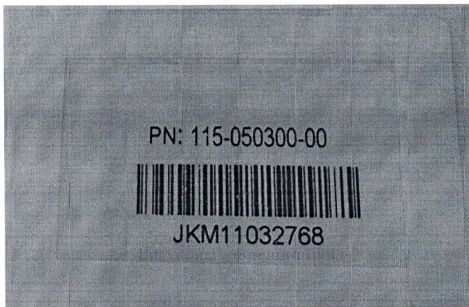
Рисунок 2 – Маркировка