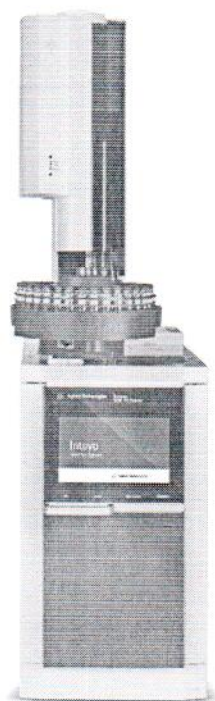
Рисунок А.3 – Общий вид хроматографа Agilent 9000 Intuvo