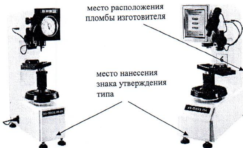
Рисунок 3 – Общий вид твердомеров УТ 5021М-01 Tochline