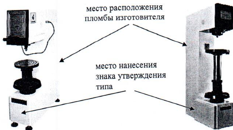
Рисунок 4 – Общий вид твердомеров ТБ 5015А Tochline