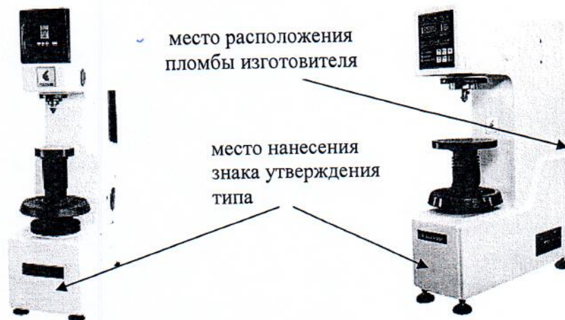
Рисунок 2 – Общий вид твердомеров ТБ 5015 Tochline