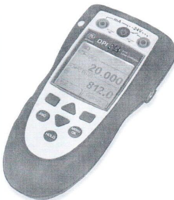
Рисунок 3 – Калибратор DPI 811