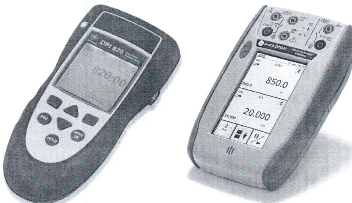
Рисунок 1 – Калибраторы многофункциональные серии DPI

Схема с указанием мест нанесения знака поверки (клейма-наклейки) приведена в приложении к описанию типа.