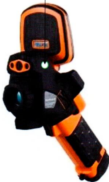
Рисунок Б.1 - Место нанесения знака поверки в виде клейма-наклейки

Место нанесения знака поверки (клеймо-наклейка)