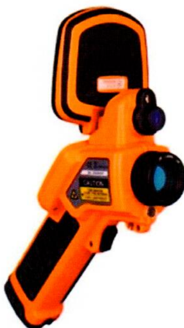
Рисунок А.1 – Внешний вид камер