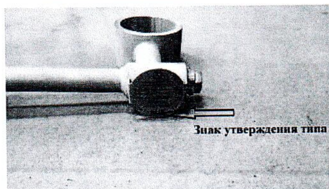
Рисунок 2 – Схема пломбировки от несанкционированного доступа, обозначение мест для нанесения знака поверки и знака утверждения типа