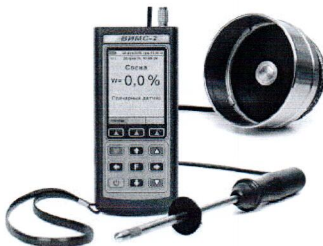
Рисунок 5 – Общий вид прибора модификации ВИМС-2.21