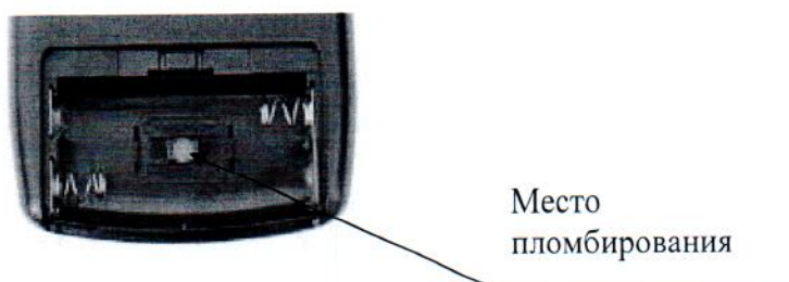
Рисунок 1 - Место пломбирования и клеймена влагомеров модификаций ВИМС-2.11, ВИМС-2.12