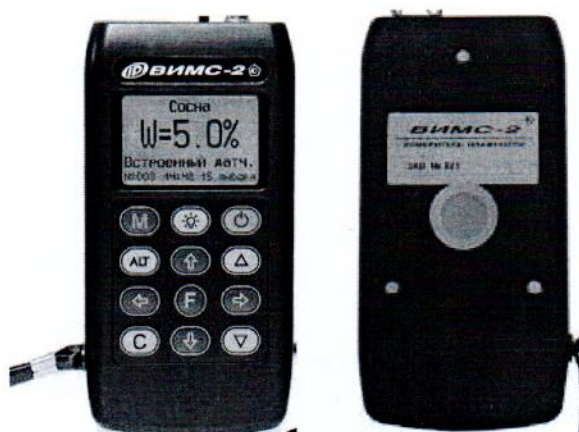
Рисунок 3 – Общий вид прибора модификации ВИМС-2.11