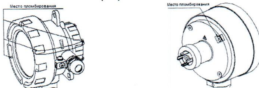
Рисунок 5 – Схема пломбировки ЭКМ от несанкционированного доступа