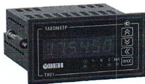
Рисунок 3 - Общий вид счетчиков в корпусе для щитового (Щ2) крепления

Пломбирование счетчиков не предусмотрено.