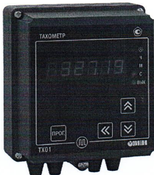
Рисунок 2 - Общий вид счетчиков в корпусе для настенного (Н) крепления

Общий вид счетчиков представлен на рисунках 2 и 3.