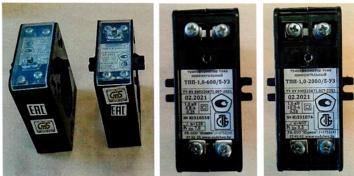
Рисунок А.2 – Внешний вид и образец маркировки трансформаторов тока ТПП и ТПП-Н