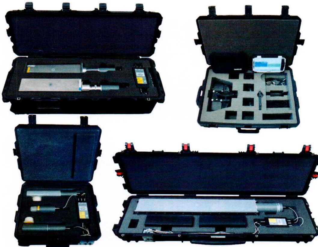
Рисунок 1 – Общий вид основных измерителей комплекса

Общий вид основных измерителей комплекса представлен на рисунке 1.