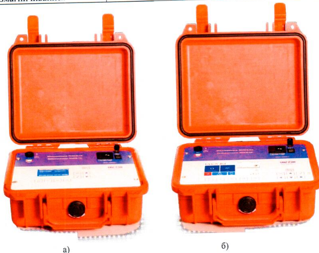
Рисунок 1 – Общий вид средства измерений