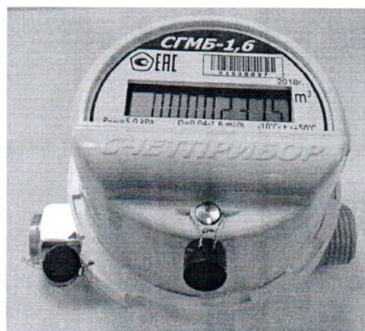
Модификация с батарейным отсеком (Б)