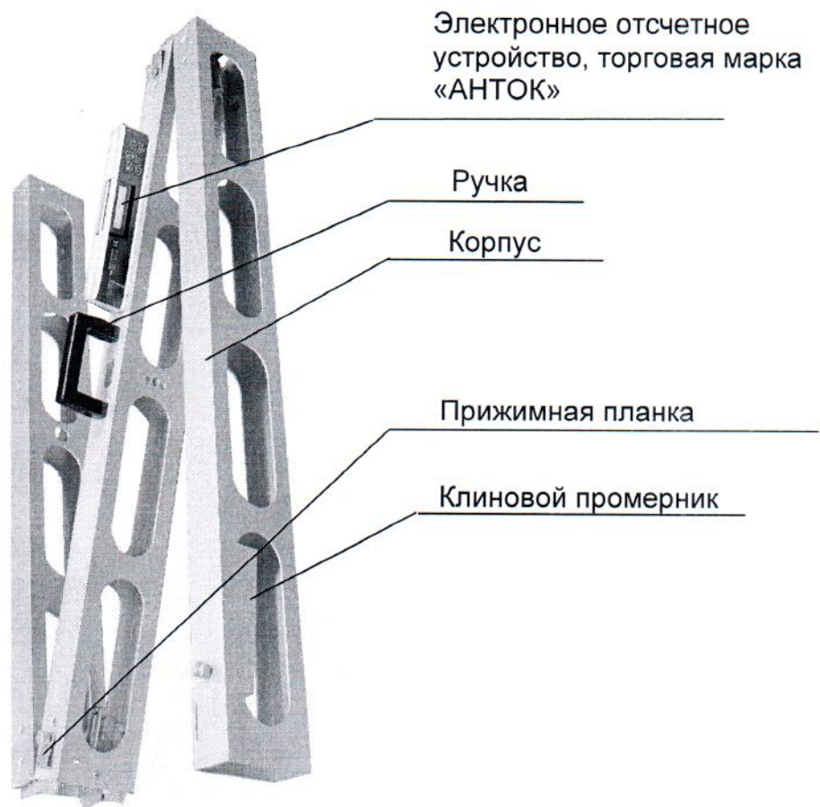
Рисунок 2 – Внешний вид рейки дорожной универсальной РДУ-АНДОР-Э