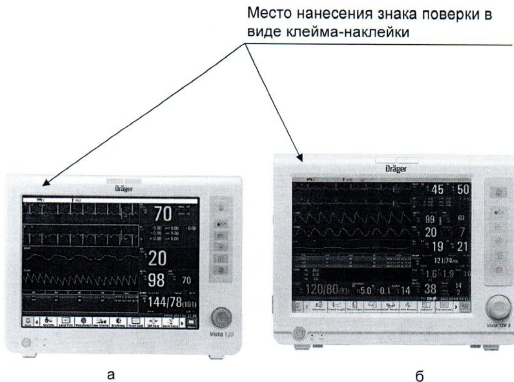
Рисунок А.1– Место нанесения знака поверки в виде клейма-наклейки на системы мониторингования пациента Vista 120, Vista 120S (а – Vista 120; б – Vista 120S)

Схема места для нанесения клейма-наклейки