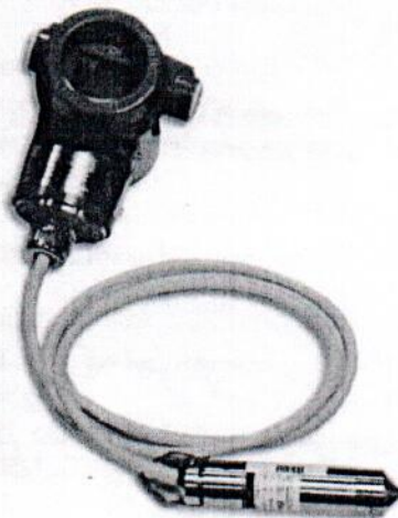
Рисунок 3 – Общий вид преобразователей исполнений ОВЕН ПД200-ДГ