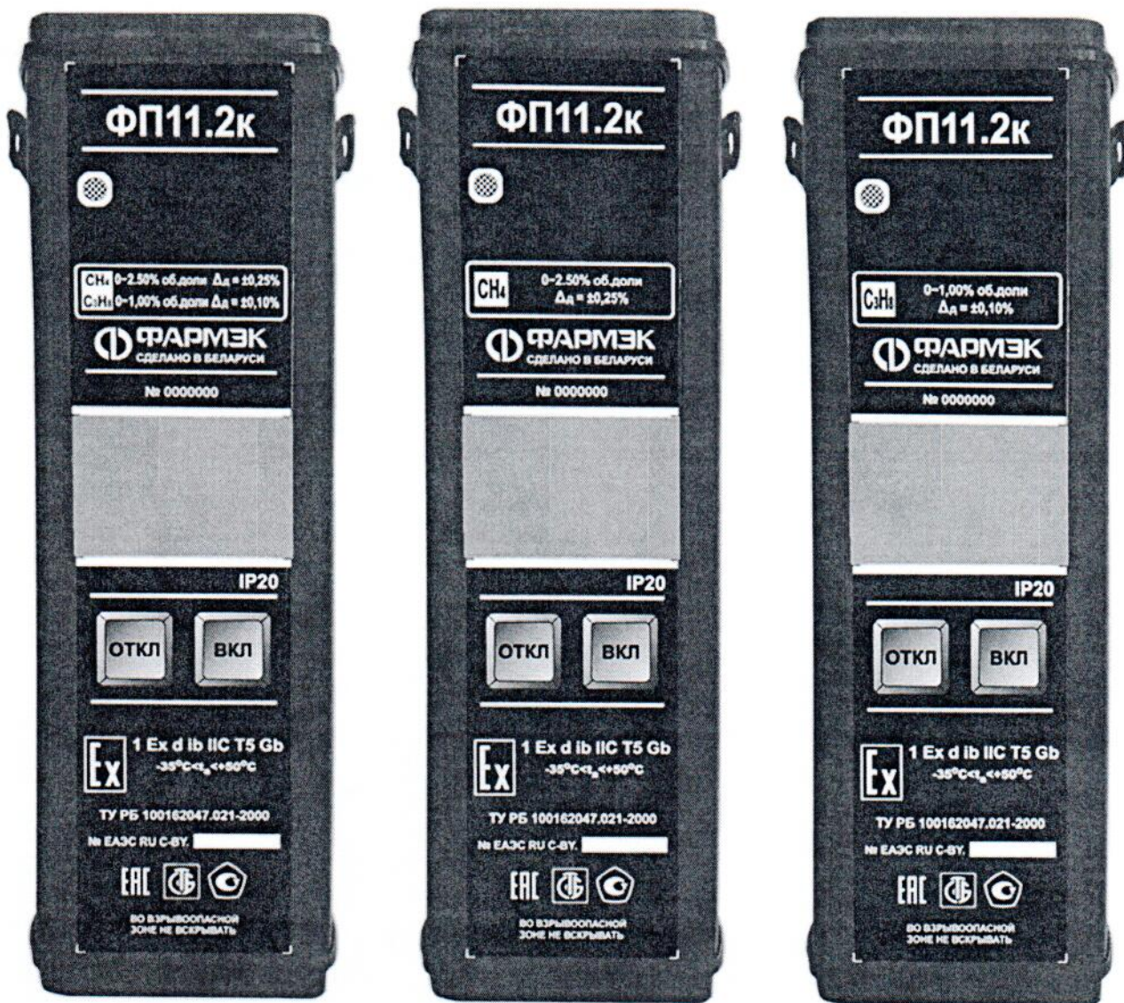
Рисунок 1а - Внешний вид газоанализаторов с термокаталитическим датчиком.

Схема пломбировки для защиты от несанкционированного доступа с указанием места для нанесения знака поверки и места пломбировки изготовителем приведена в приложении А к Описанию типа.