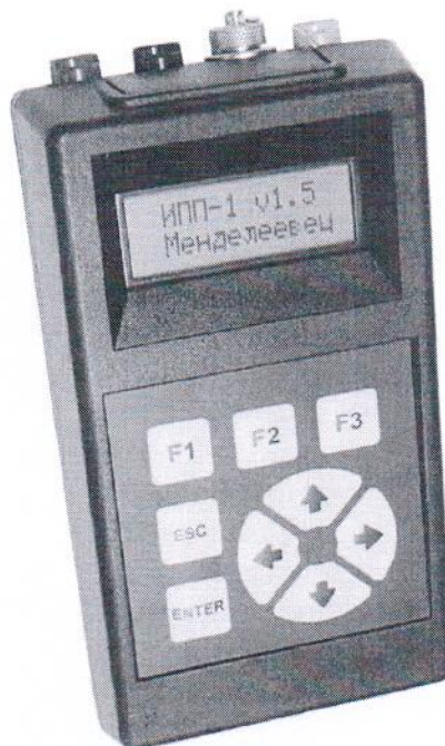
Рисунок 1 – Внешний вид измерителей

Внешний вид измерителей представлен на рисунке 1.