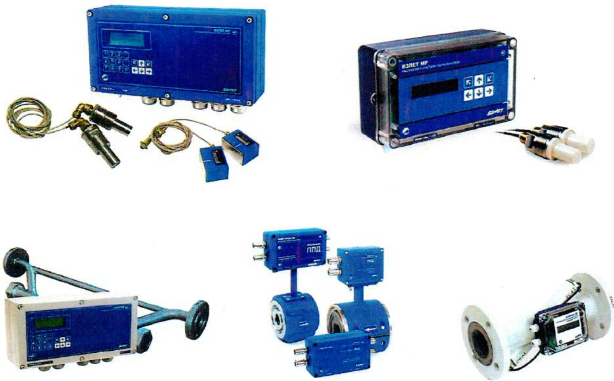
Рисунок 1 – Общий вид расходомеров-счетчиков ультразвуковых «ВЗЛЕТ МР» различных исполнений

Общий вид расходомеров-счетчиков ультразвуковых «ВЗЛЕТ МР» представлен на рисунке 1.