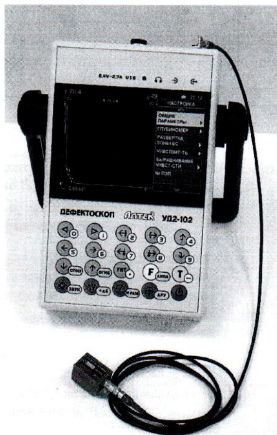
Рисунок 1 – Общий вид

БЭ включает в себя устройство обработки, приемо-возбудитель, клавиатуру и дисплей. Фотография общего вида дефектоскопа представлена на рисунке 1