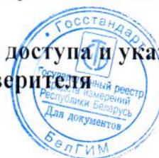
Рисунок А.2 – Схема пломбировки от несанкционированного доступа и указание мест для нанесения оттисков клейм ОТК и поверителя на заднюю панель ваттметров

Примечание – Оттиски клейм находятся на двух винтах крышки, закрывающей элементы регулировки на задней панели ваттметров.