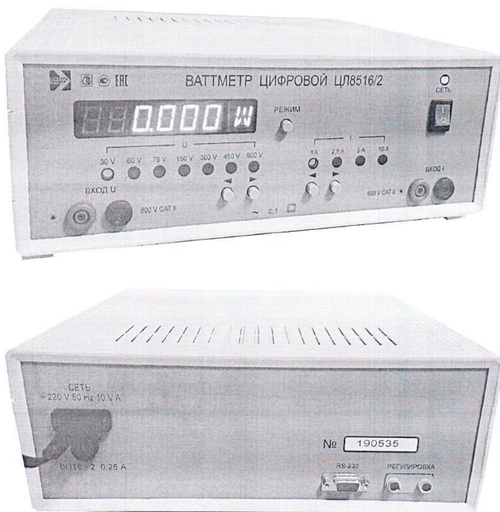
Рисунок 1 – Фотография общего вида ваттметра

Клеймо-наклейка располагается на лицевой панели ваттметров в верхнем правом углу. Фотография общего вида ваттметров приведена на рисунке 1.