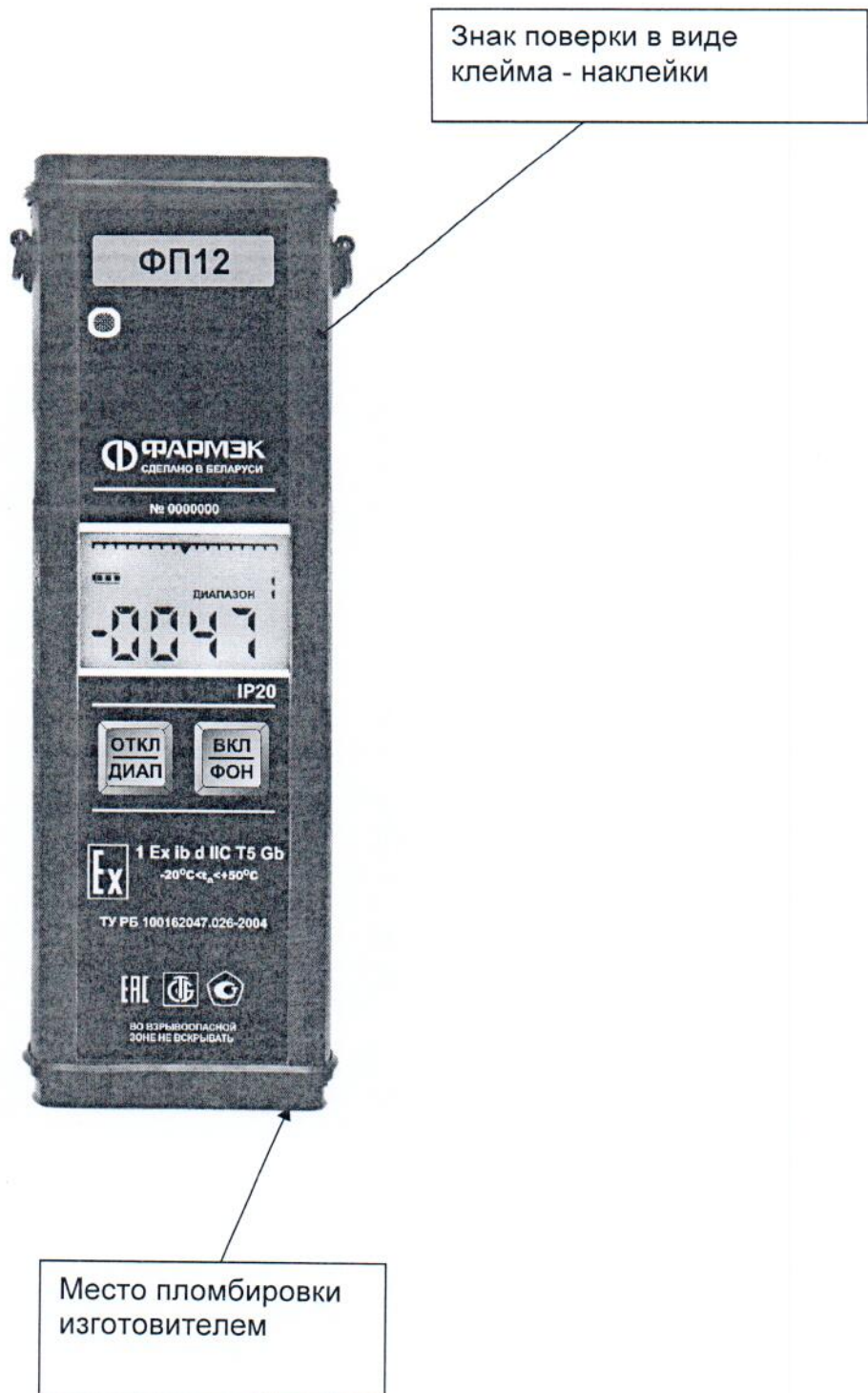
Схема пломбировки для защиты от несанкционированного доступа с указанием места для нанесения знака поверки