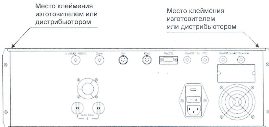
Рисунок А.1 – Места клеймения счетчика