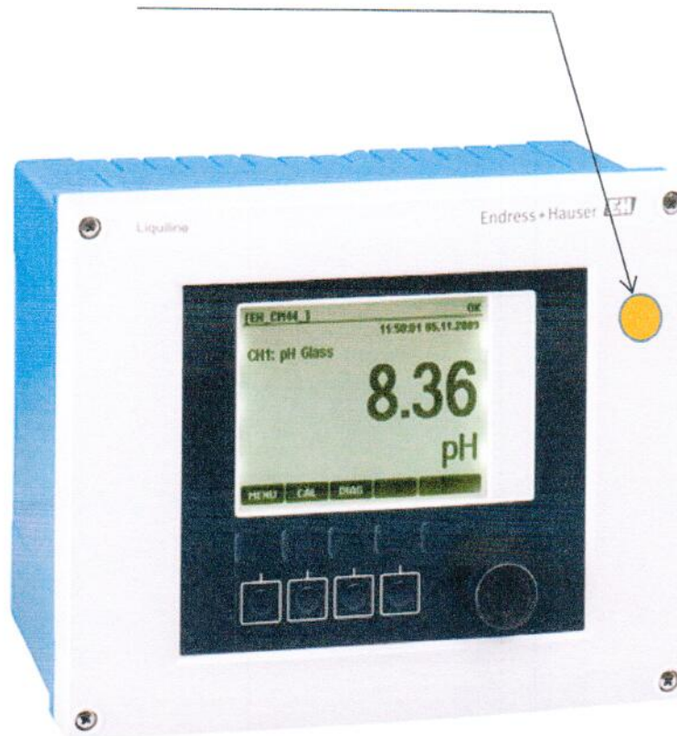
Рисунок А.1 - Место нанесения клейма – наклейки на измерительный преобразователь анализатора жидкости серии Liquiline