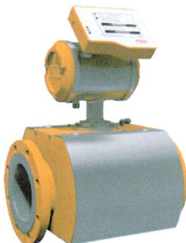
Рисунок 1. Внешний вид счетчика

Место нанесение знака поверки в виде клейма-наклейки указаны в Приложение А к описанию типа.