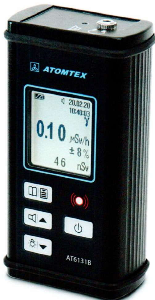
Рисунок 1 – Внешний вид приборов

Место нанесения знака поверки (клейма-наклейки) приведено на рисунке 2.