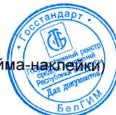
Рисунок 2 – Место нанесения знака поверки (клейма-наклейки)

Место нанесения знака поверки (клейма-наклейки)