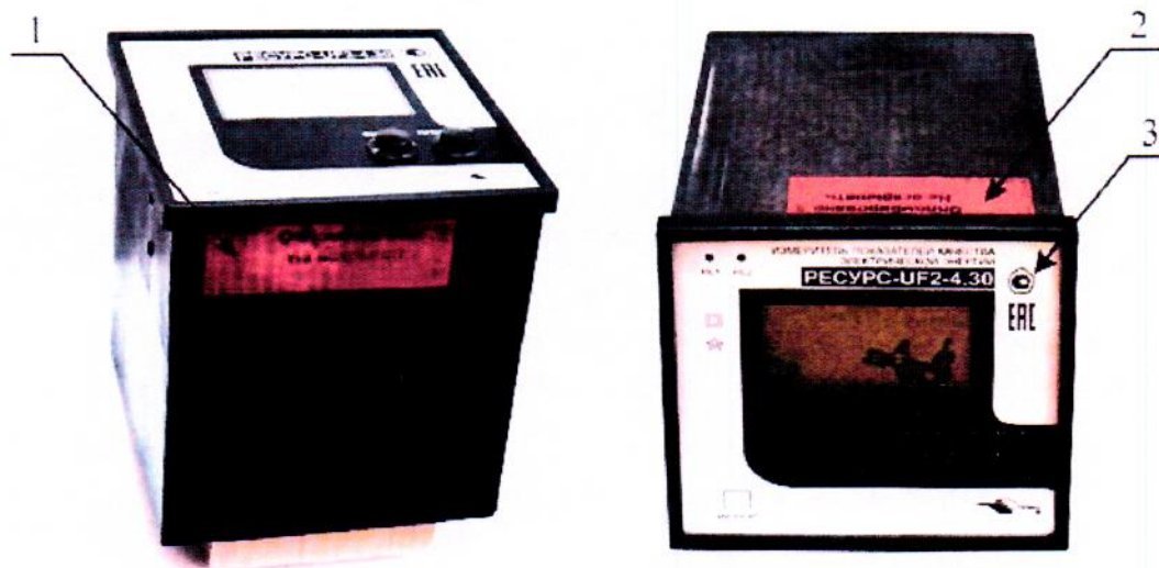
Рисунок 1 – Общий вид и схема пломбировки от несанкционированного доступа приборов «Ресурс-UF2-4.30-X-X-н-XXX»