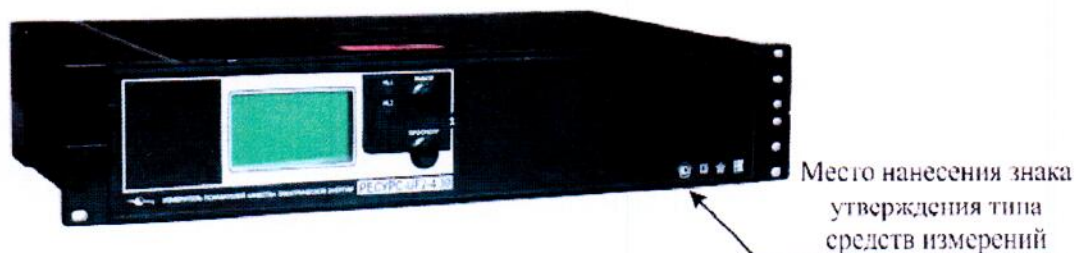
Рисунок 3 – Общий вид приборов «Ресурс-UF2-4.30-X-X-c-XXX»