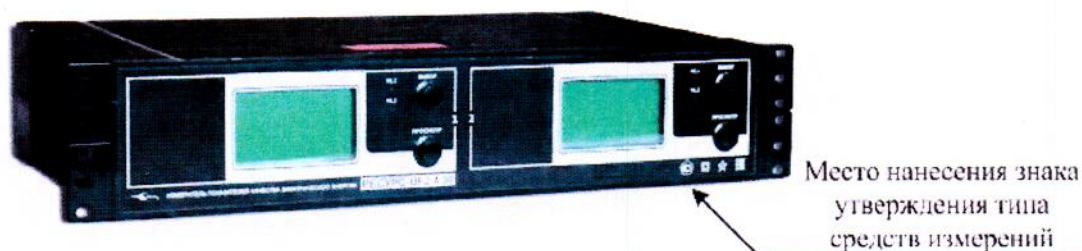
Рисунок 4 – Общий вид приборов «Ресурс-UF2-4.30-X-X-2c-XXX»