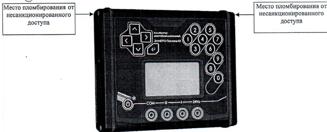
Рисунок 1 – Общий вид калибраторов и место пломбирования от несанкционированного доступа