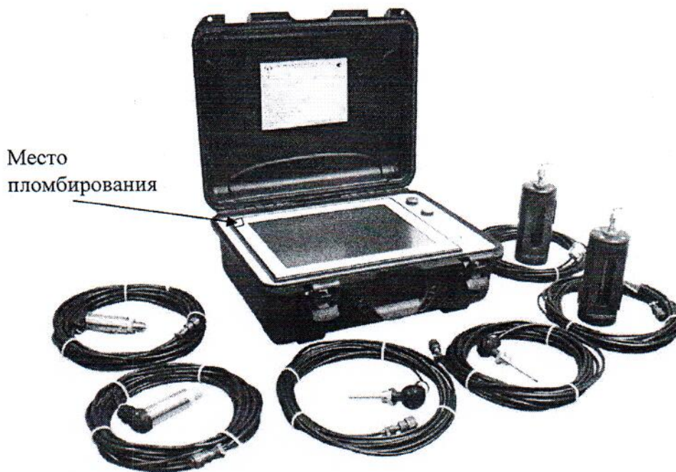
Рисунок 3 - Фотография общего вида модификации II - «Промышленный кейс»

Пломбирование систем от несанкционированного доступа осуществляется путем наклейки с изображением товарного знака предприятия-изготовителя.