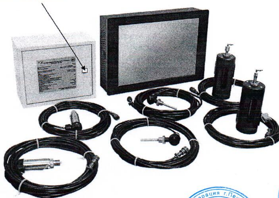
Рисунок 2 - Фотография общего вида модификации I - «Терминал»