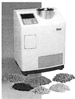
Рисунок 1 Анализатор влажности зерна Aquamatic 5100

Внешний вид анализаторов приведен на рисунке 1.