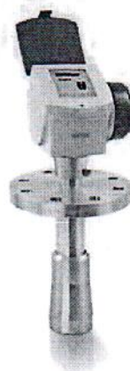
в) 7300 С