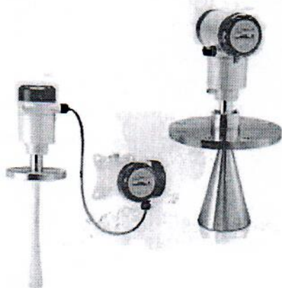
а) 5200 F и 5200 C

На рисунке 1 изображен общий вид уровнемеров.