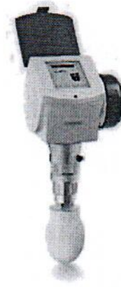
б) 6300 C