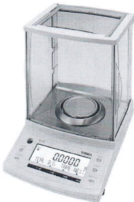
Рисунок 1 – Внешний вид весов неавтоматического действия серии НТ

Место нанесения знака поверки в виде клейма-наклейки приведено в приложении А.