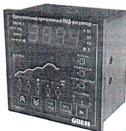
Рис.2 - Общий вид приборов в корпусе ЦД – для щитового крепления