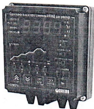
Рис.1 - Общий вид приборов в корпусе Н – для настенного крепления

Фотографии общего вида приборов приведены на рисунках 1 и 2.