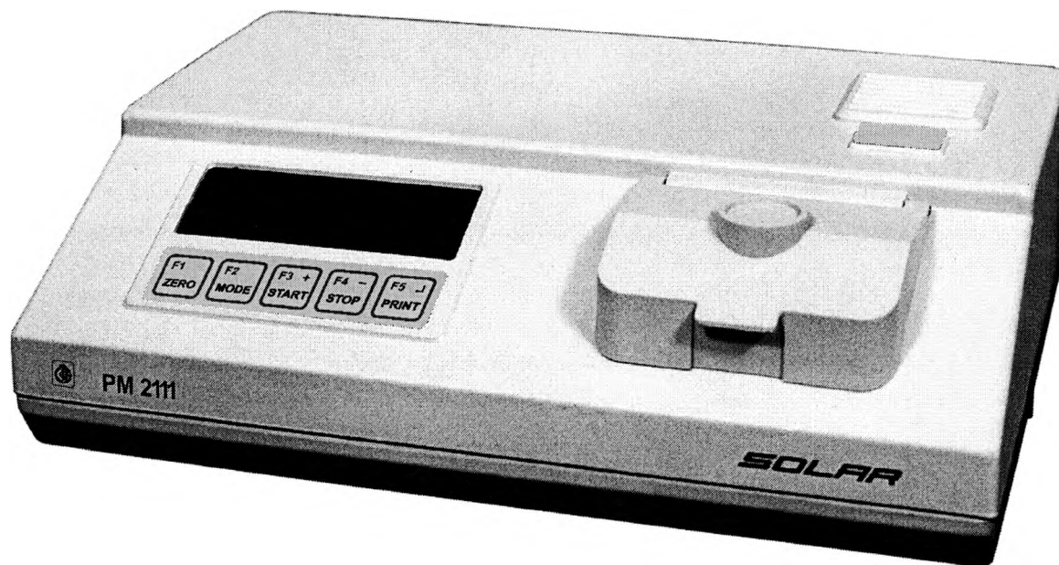
Рисунок 1 – Внешний вид фотометра РМ 2111

Внешний вид фотометра приведен на рисунке 1.