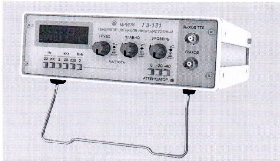
Рисунок 1 – Генератор сигналов низкочастотный ГЗ-131. Внешний вид

Место нанесения знака поверки (клейма-наклейки) приведено в приложении А, рисунок А.3; место пломбирования и оттиска поверительного клейма приведены в приложении А, рисунок А.2.