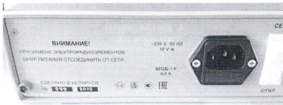
Рисунок А.1 – Задняя панель генератора