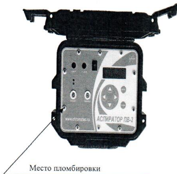
Рисунок 2 – Схема пломбировки от несанкционированного доступа, обозначение места нанесения знака поверки