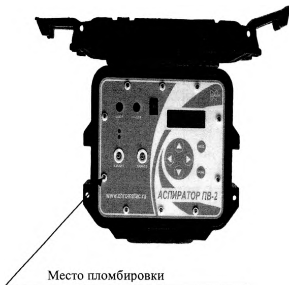
Рисунок 2 – Схема пломбировки от несанкционированного доступа, обозначение места нанесения знака поверки