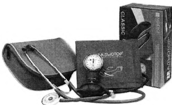
Рисунок 1 Общий вид

измерителей артериального давления серии ИАД-01-«Адьютор» в исполнениях ИАД-01-1-«Адьютор», ИАД-01-1А-«Адьютор», ИАД-01-1Э-«Адьютор», ИАД-01-1Д-«Адьютор», ИАД-01-1К-«Адьютор» «Коротков»®