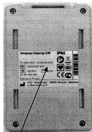
Защитная наклейка Рисунок 3 – Схема маркировки блока регистрации