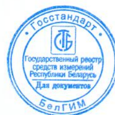
Рисунок А.1 – Место нанесения знака поверки в виде клейма-наклейки

Место нанесения знака поверки в виде клейма-наклейки