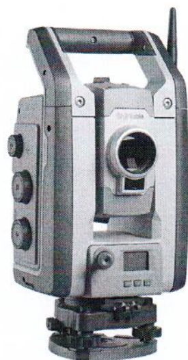
Trimble S9 / Trimble S9 HP