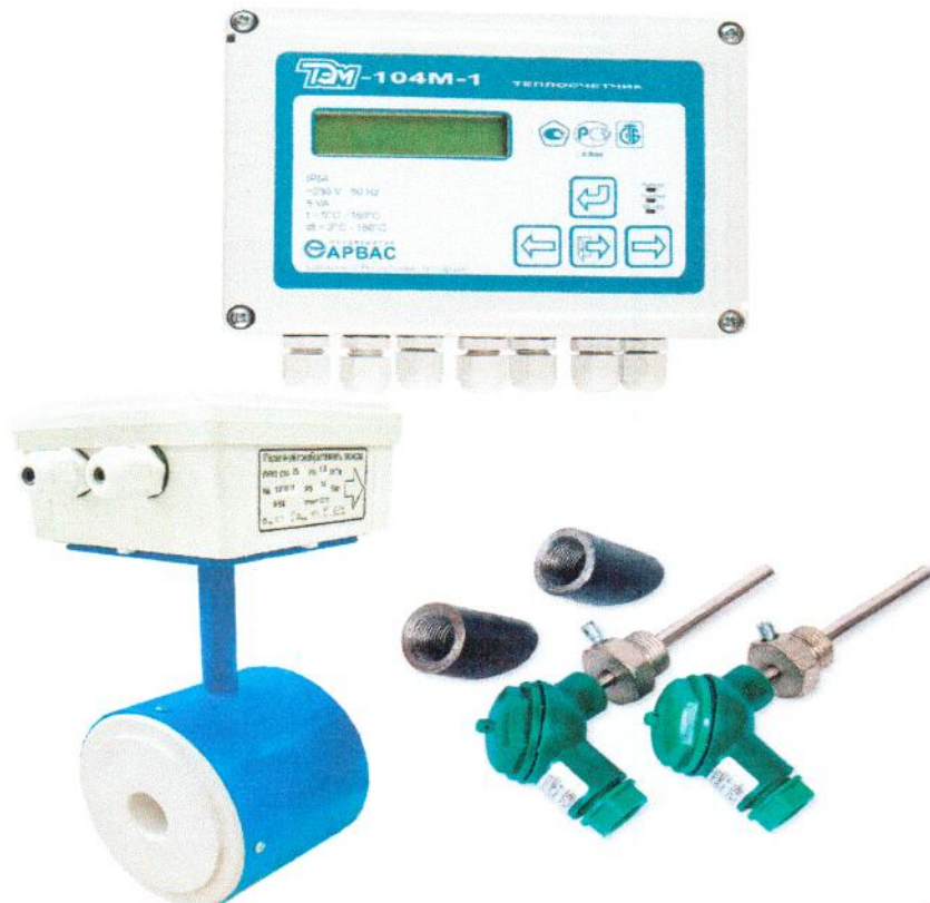
Рисунок 2. Внешний вид теплосчётчика (исполнение ТЭМ-104М-1)