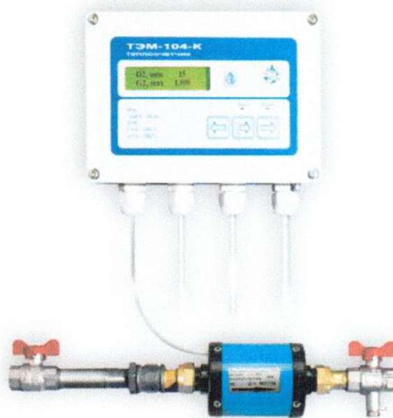
Рисунок 3. Внешний вид теплосчетчика (исполнение ТЭМ-104-К)

Схема пломбировки теплосчетчика для защиты от несанкционированного доступа с указанием мест для нанесения оттиска знака поверки и знака поверки в виде клейма-наклейки приведена в приложении Б к описанию типа.