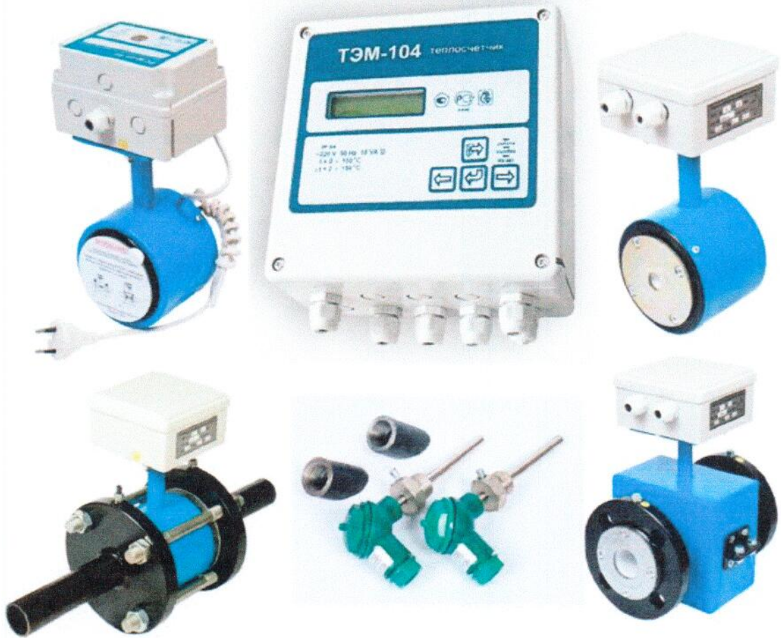
Рисунок 1. Внешний вид теплосчетчика (исполнение ТЭМ-104-4 или ТЭМ-104М-4)

Внешний вид теплосчетчика приведен на рисунках 1, 2 и 3.