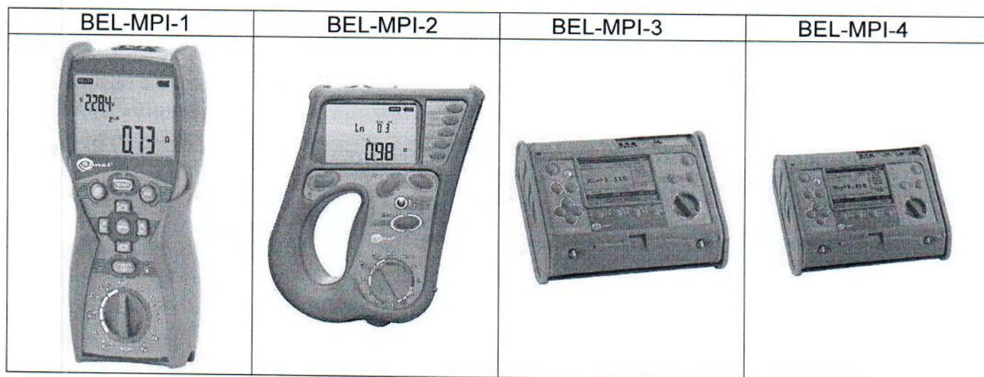
Рисунок 1 - Виды исполнений измерителей.

Схема с указанием места нанесения знака поверки (клейма-наклейки) приведена в приложении А к описанию типа.