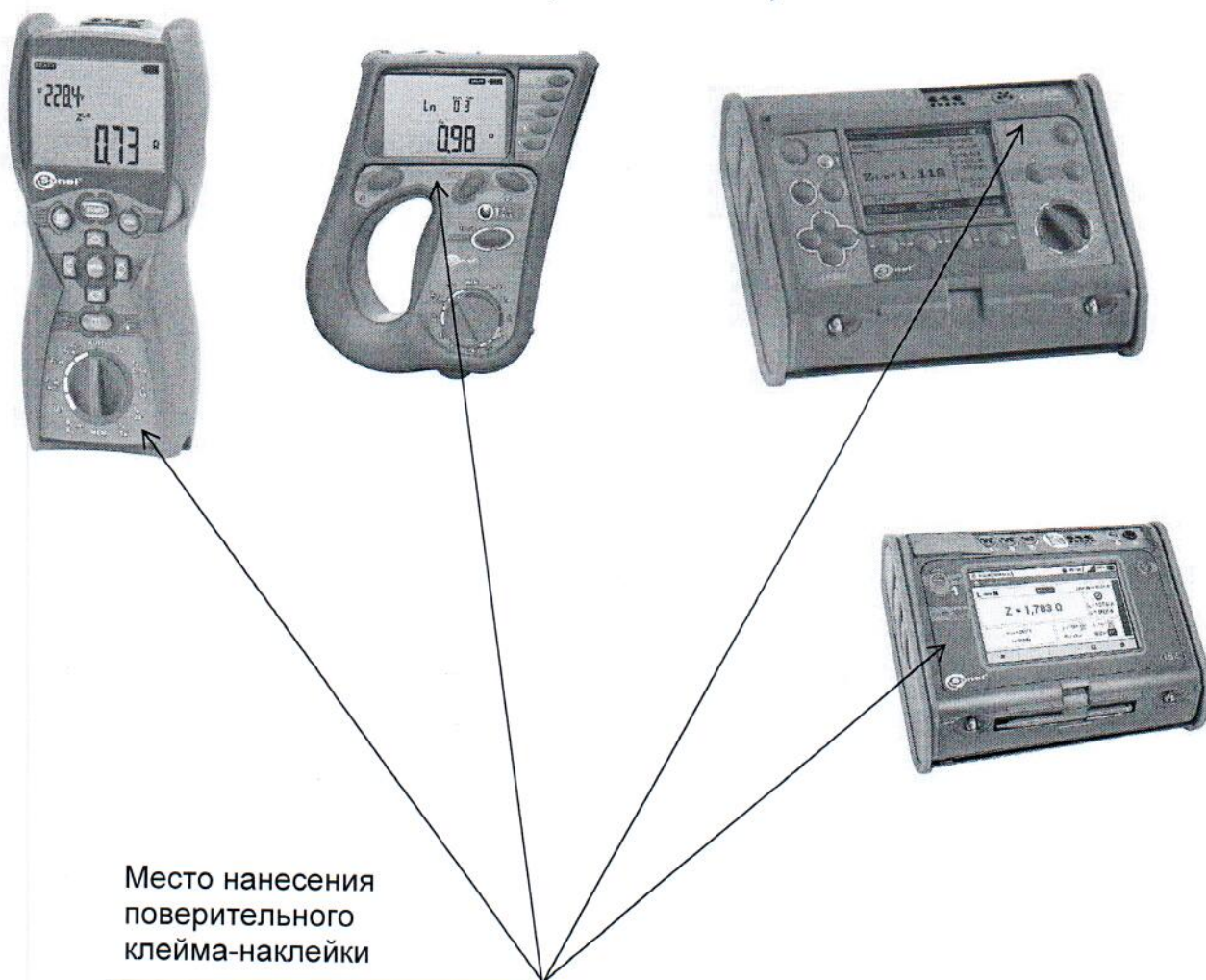
Рисунок А.1 – Место нанесения поверительного клейма-наклейки