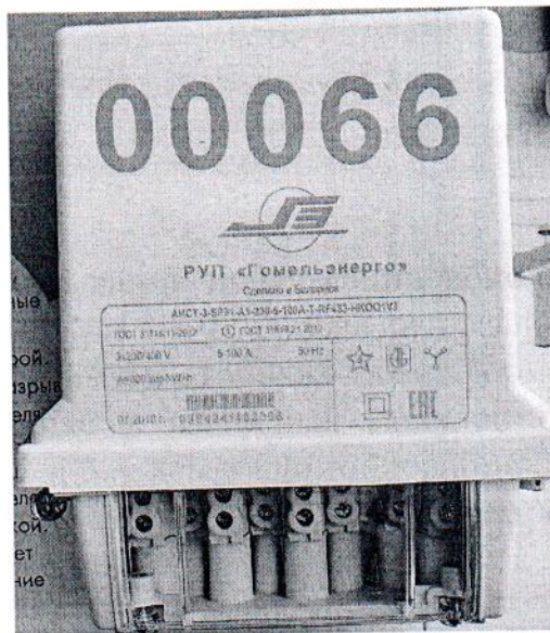
Рисунок 2 – Внешний вид счетчика.

Внешний вид счетчика и выносных модулей отображения информации представлен на рисунках 2 и 3. Схемы пломбирования счетчиков от несанкционированного доступа к элементам счетчика с указанием мест нанесения знаков поверки приведены в приложении А.