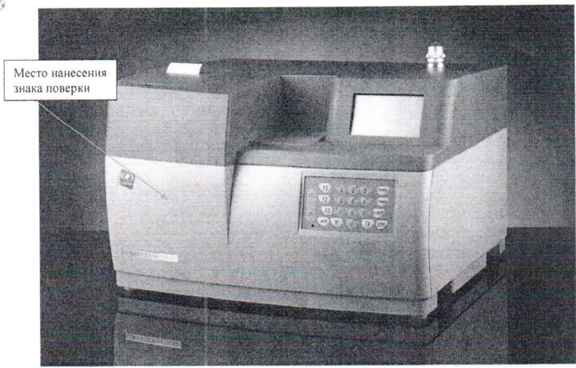
Рисунок 1 - Общий вид анализатора СПЕКТРОСКАН SW-D3